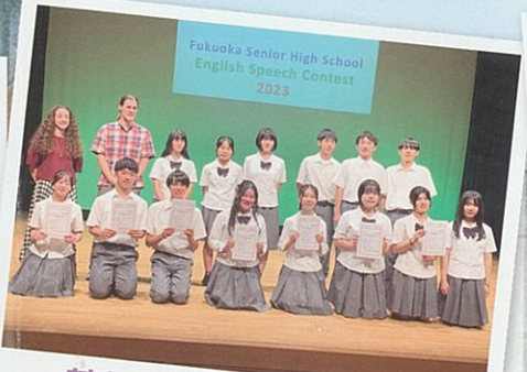
英語スピーチコンテスト