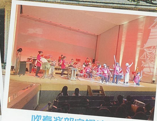
吹奏楽部定期演奏会