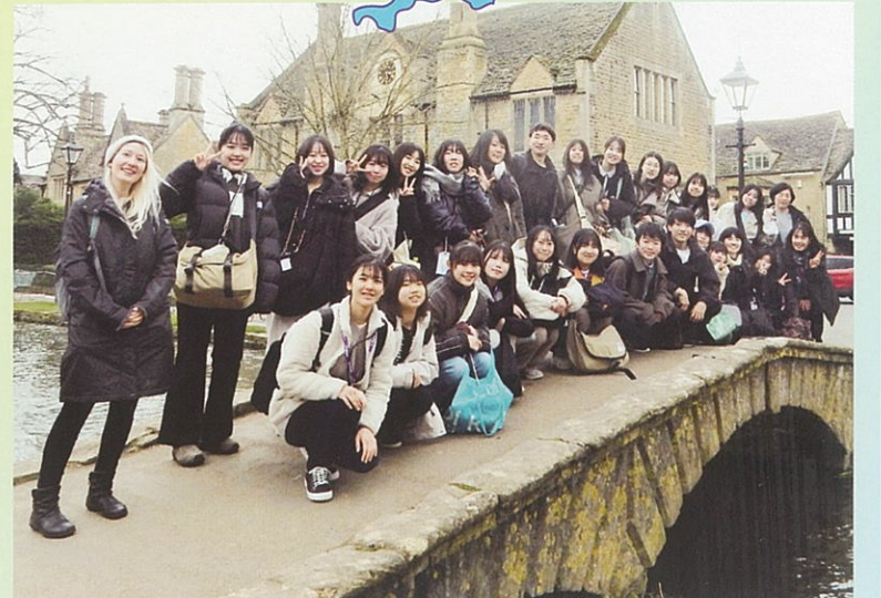
ボートンオンザウォーターにて