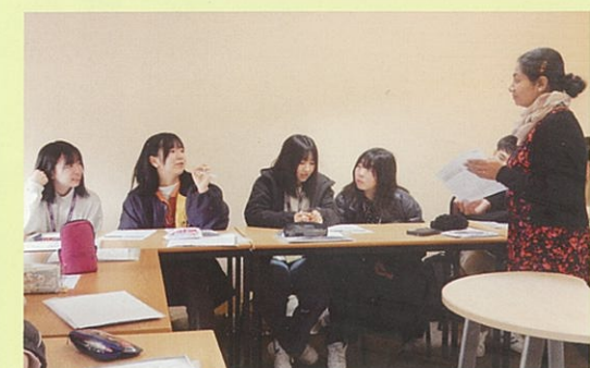
語学学校での授業風景

毎年3月に、約25名の生徒が、語学研修のため英国を訪れています。期間は、10日間。チェルトナムの語学学校に通い、午前中は英語で授業を受けます。午後は近郊の歴史的建造物を訪問したり、現地の高校に訪問交流したりし、イギリスの歴史と文化に触れます。