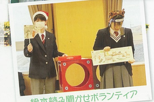
絵本読み聞かせボランティア