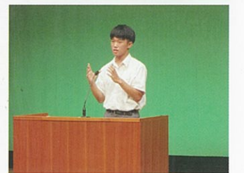
(スピーチコンテスト)