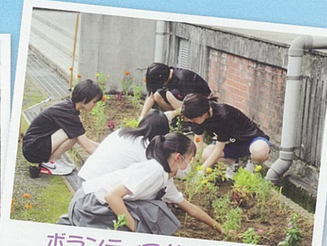
ボランティア(花壇整備)