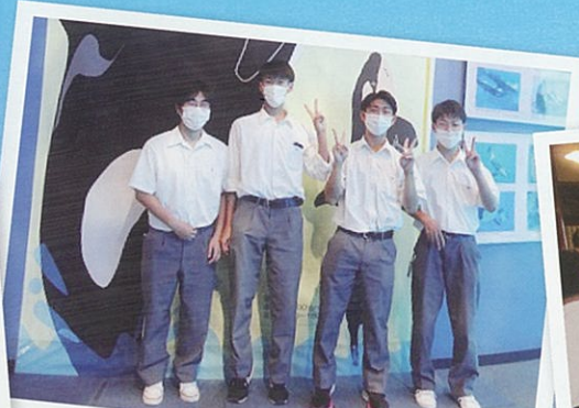
2学年 進路研修旅行