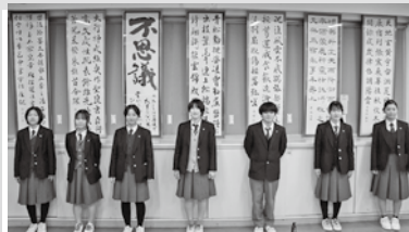
令和6年 富山県青少年美術展出展作品