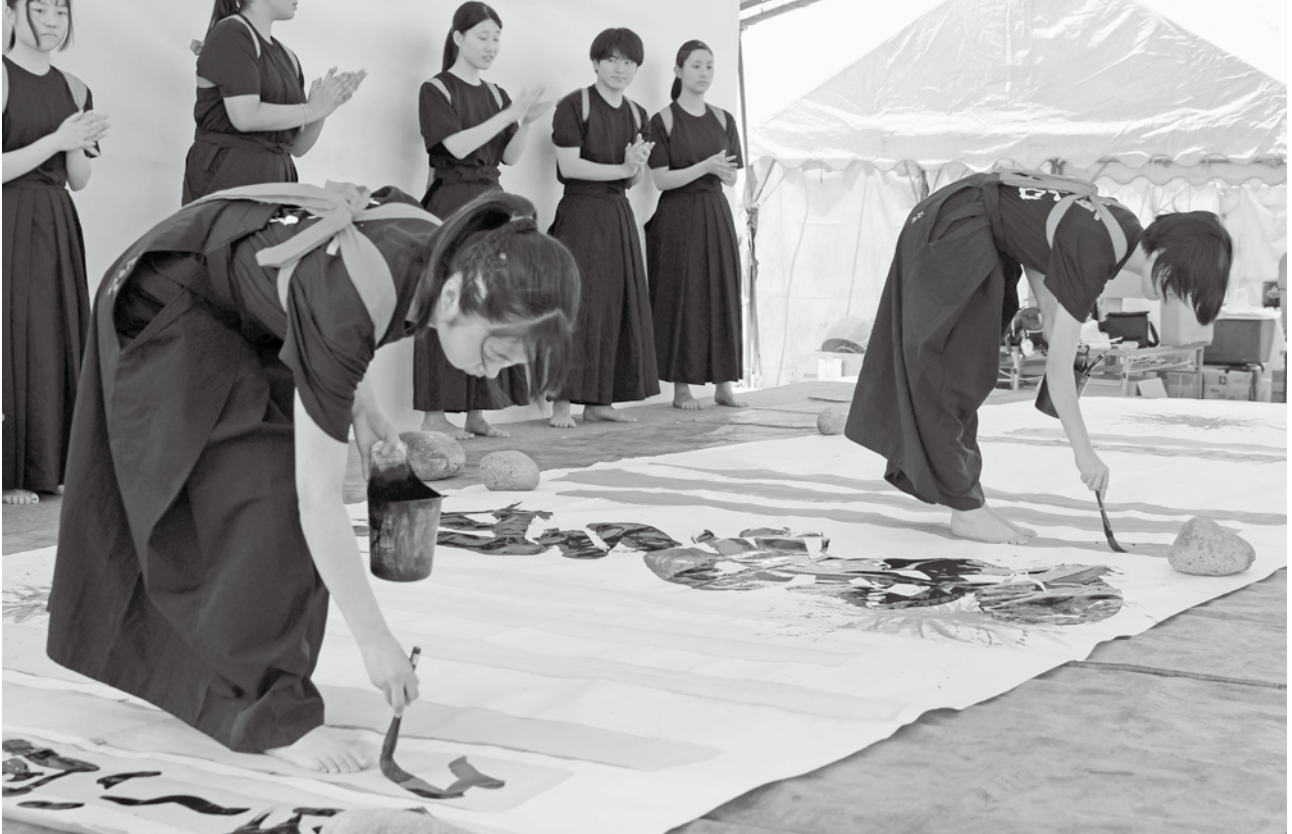
書道部（イベントでのパフォーマンス）

ホームページ URL https://www.fukuoka-h.tym.ed.jp/graduate/reunion