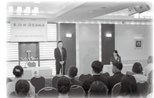
写真は令和6年総会風景