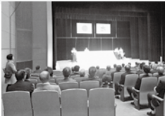
2016.1.3福岡町賀詞交歓会にて